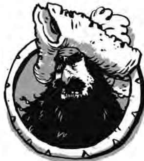
ZULO BELTZ BIZARTSU