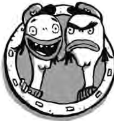
KAKO ETA TAKO