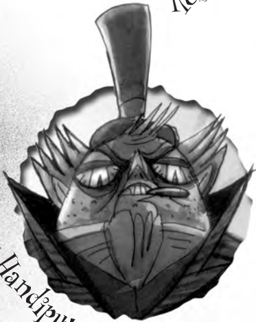
Ott Handiputz jauna