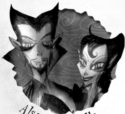
Alston eta Bella Negatibo