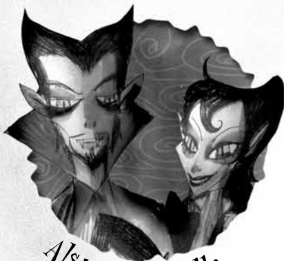
Alston eta Bella Negatiboa