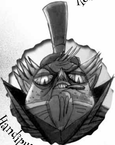
Ott Handiputz jauna